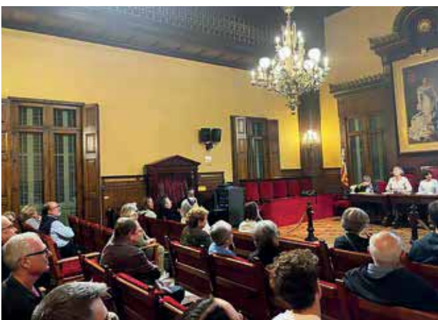
Sarrià - Sant Gervasi