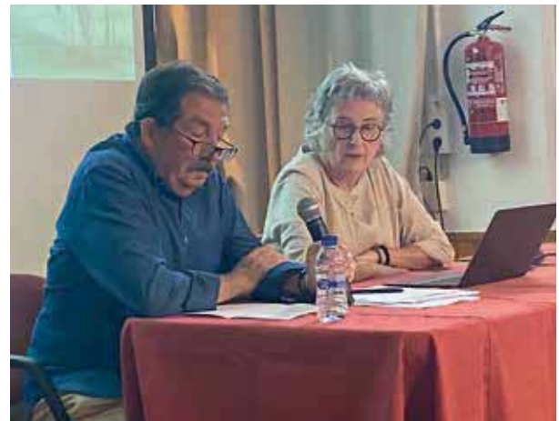
Sant Cugat - Valldoreix