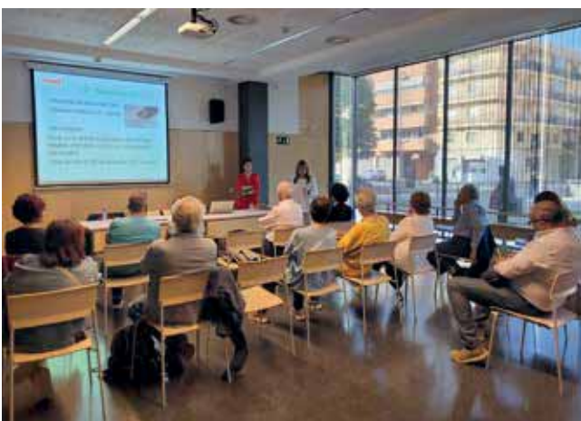
Sant Joan Despí