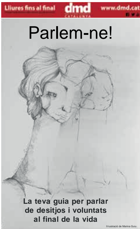
Guia sobre els drets al final de la vida