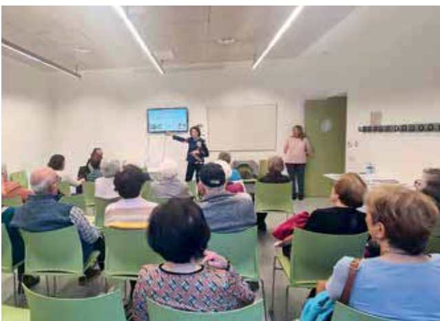
Fabra i Coats