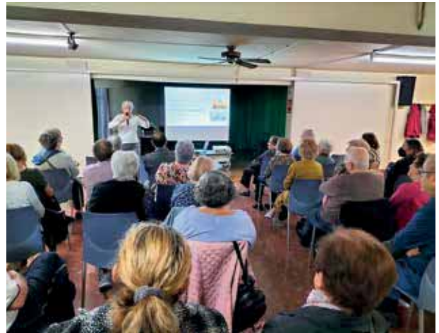
Bac de Roda