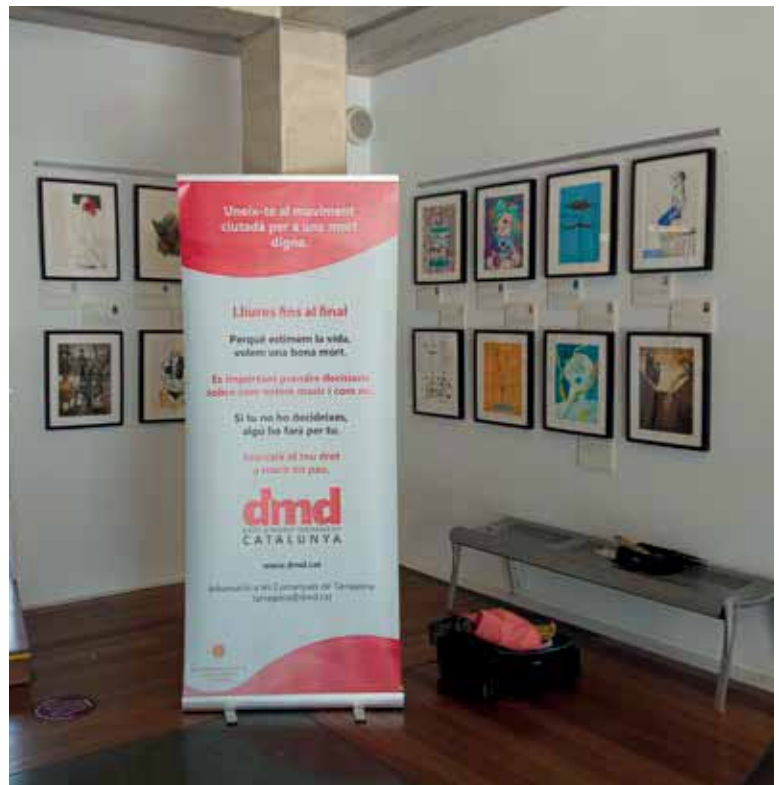
L'exposició "La Mort, Digna i Il·lustrada"