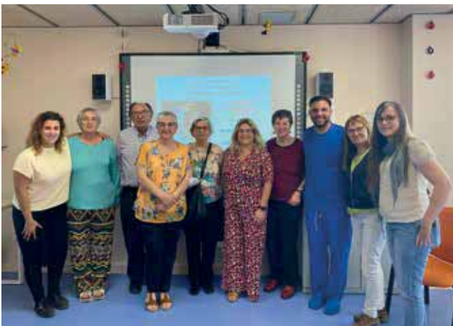
Molins de Rei