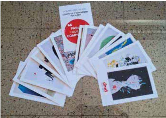
Joc de valors

A DMD-Cat fem pedagogia de la mort i disposem de diferents recursos didàctics com són el Joc de valors al final de la vida, l'exposició "La Mort, Digna i Il·lustrada", la guia "Parlem-ne" sobre els drets al final de la vida i les maletes pedagògiques que contenen llibres il·lustrats per a l'educació de primària.